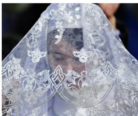
صدای زنان و دختران در این کشور در حال خاموش شدن می باشد.