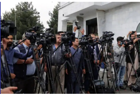
در سایه بحران؛ خبرنگاران...