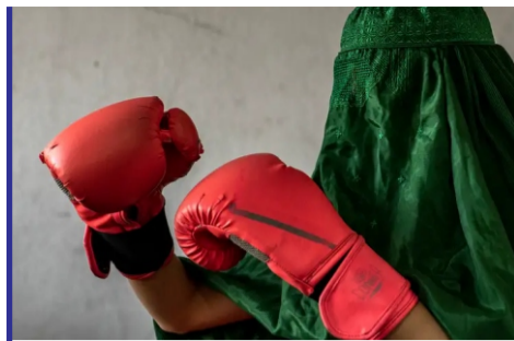
چالش های زنان ورزشی کار...