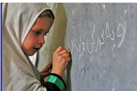
از روز جهانی سواد آموزی تا...