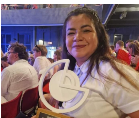
کوتاه انتخاب شده است.