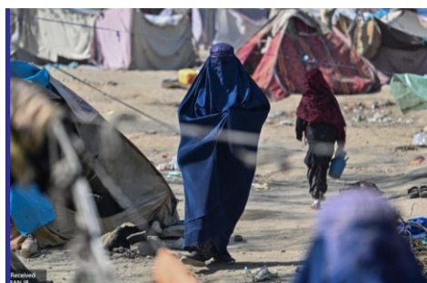
شناخته شدن افغانستان به ...