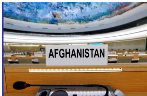
بررسی نتایج سومین نشست ...