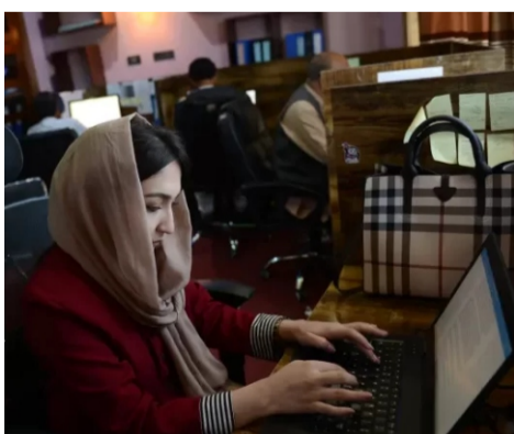
آنان زنان خبرنگار خواهند بود.

این حمایت یونسکو در حالی صورت می گیرد که