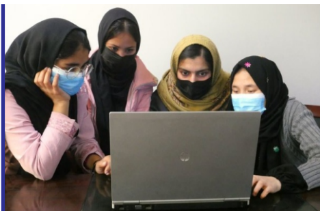
افزایش کسب و کار آنلاین در...