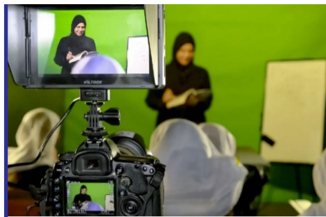
حمایت سازمان ملل از زنان...