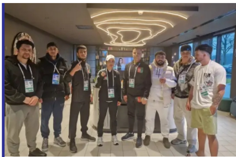
تلاش ورزشکاران افغان جهت...