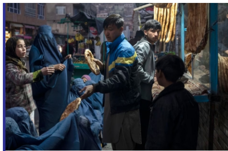
از وضع محدودیت ها در برابر...