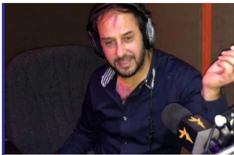
افراد مسلح ناشناس بریک...