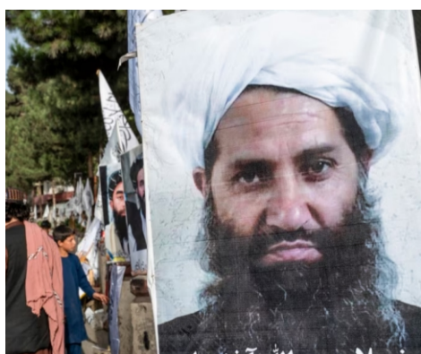
معاشات کارمندان از ابتدای ماه حمل سال جاری ۱۴۰۳ متوقف شود.